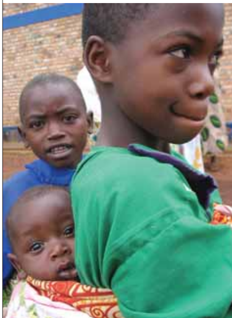
Guarda il video del progetto su AVSI Tube oppure richiedi il dvd: sostegno.distanza@avsi.org

Nel rapporto con i sostenitori italiani , il progetto ha mantenuto la stessa metodologia, ma il grande numero di bambini coinvolti ci ha portato a ripensare il sostegno personalizzato cercando di ottimizzare le risorse impiegate per la corrispondenza con l'Italia. Le schede che gli operatori compilano per conoscere il bambino e la sua famiglia e pianificare il miglior intervento sono le stesse che vengono inviate ai sostenitori; gli in-