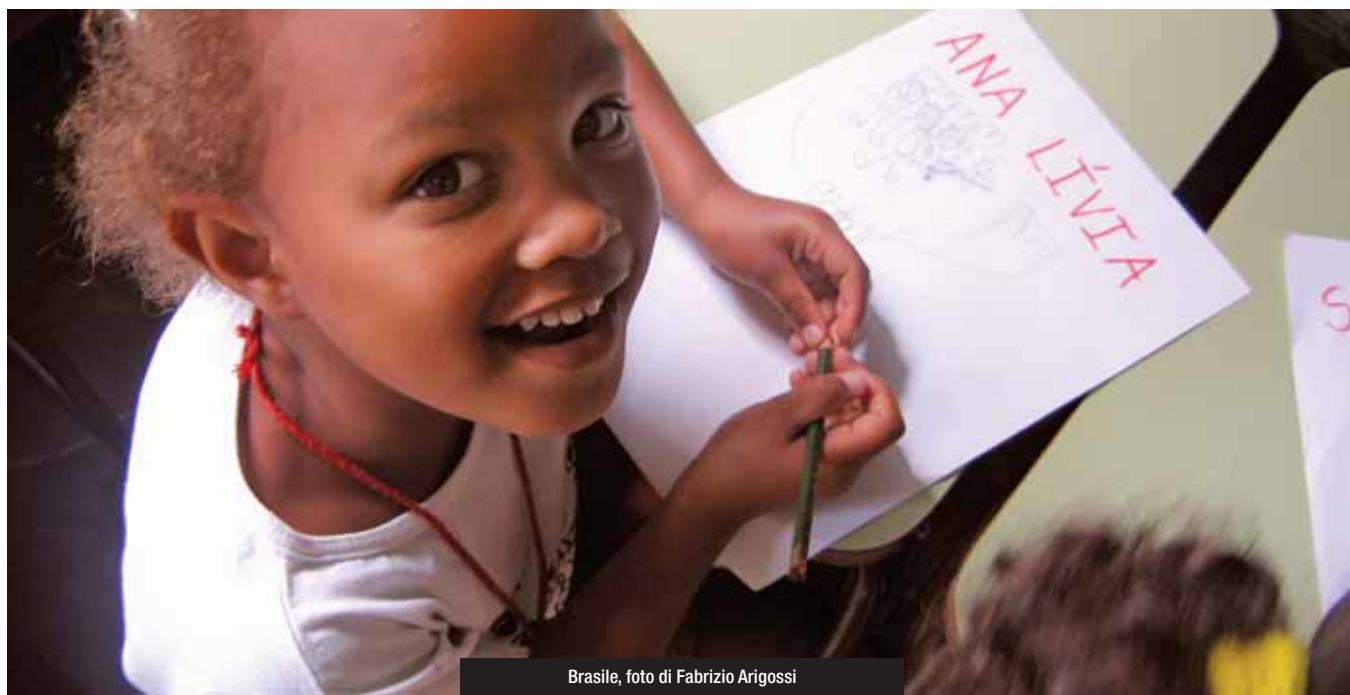
Brasile