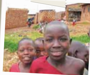
Uganda, ragazzini del Meeting Point International di Kampala