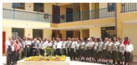
Kenya, nuova scuola

siderio di bellezza che è presente in ciascuno di noi” e ha invitato tutti a “mantenere vivo tutti i giorni questo desiderio di bellezza e di giustizia, soprattutto in un momento così tragico per il Paese”. Anche il fatto che la scuola sia frequentata da studenti di diverse tribù è un segno importante di speranza e di riconciliazione per tutti.