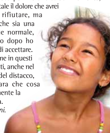
Brasile, Belo Horizonte