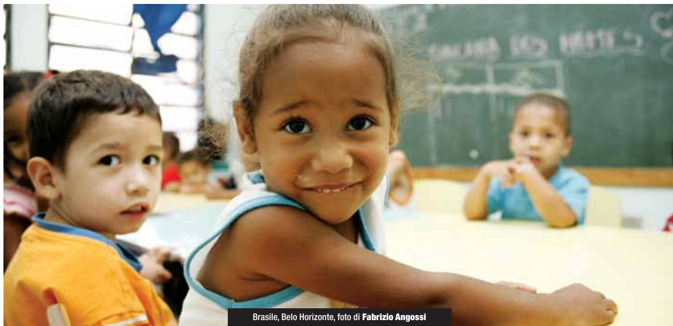
Brasile, Belo Horizonte