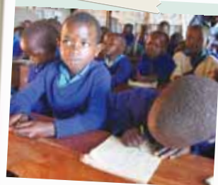
Kenya, una classe a Mutuati

O VC È UN PROGETTO CHE STA MIGLIORANDO LA VITA a più di 12.000 bambini in Uganda, Rwanda e Kenya. Coinvolge 50mila adulti con attività formative e generatrici di guadagno. Un progetto pilota finanziato dal sostegno a distanza e dalla cooperazione americana. Di Dania Tondini