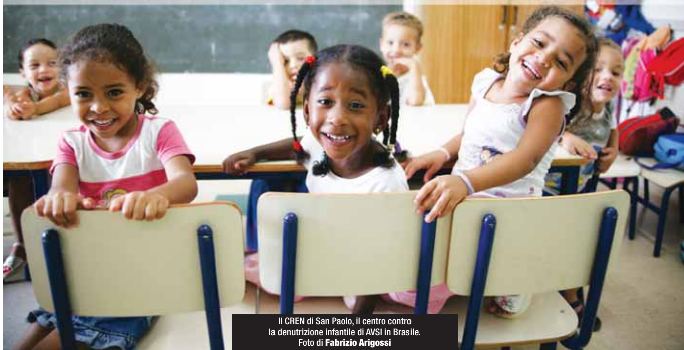
Il CREN di San Paolo, il centro contro la denutrizione infantile di AVSI in Brasile.