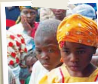
Haiti, bambini sostenuti a distanza con AVSI

Il Centro commerciale Tremestieri di Messina aiuta 20 bambini dal 2006 in Uganda e Brasile.