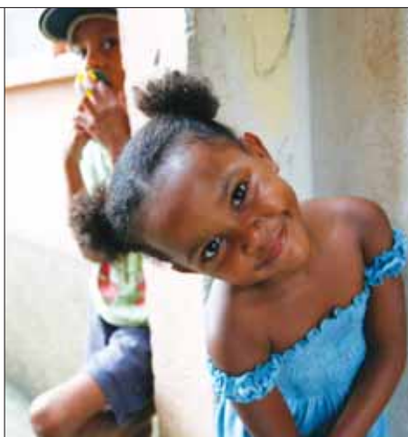
Brasile