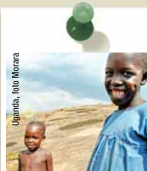
Uganda, foto Morara

“AVSI crede fortemente che lo sviluppo di una persona passa attraverso l'educazione e la conferma della sua dignità. – dice Giampaolo Silvestri, direttore progetti AVSI – Un cammino lungo ma reale che vogliamo percorrere e condividere, mettendo a disposizione la nostra esperienza e metodologia, con chiunque sia interessato.”