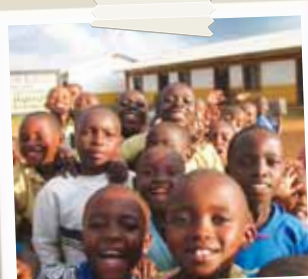
Rwanda, sulle colline di Humure