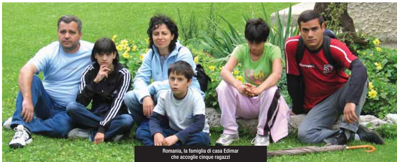
Romania, la famiglia di casa Edimar che accoglie cinque ragazzi