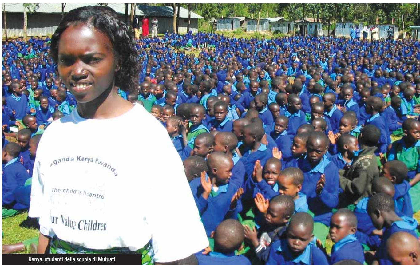
Kenya, studenti della scuola di Mutuati

S iamo nel cuore dell'Africa, nella regione dei Grandi Laghi. La presenza di AVSI risale alla fine degli anni '80, pochi anni dopo la scoperta del terribile virus dell'Aids. Quelli che stavano per morire si chiedevano chi avrebbe accudito i loro figli. Per aiutare questi orfani AVSI crea all'inizio degli anni '90 il sostegno a distanza. Nel 2005 sono già 7.000 i bambini in Uganda, Kenya e Rwanda aiutati a vivere e crescere nel loro ambito e mandati a scuola. Il progetto funziona e viene scelto e finanziato da USAID, l'agenzia di cooperazione allo sviluppo del governo degli Stati Uniti. I bambini sostenuti diventano così 12.000.