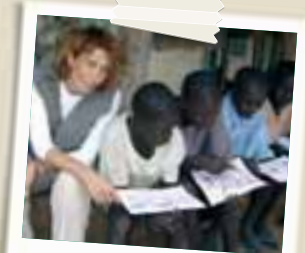
La giornalista Monica Maggioni in Uganda