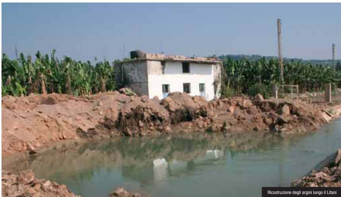
Ricostruzione degli argini lungo il Litani

U NA REGIONE SPESSO AL CENTRO DI CONFLITTI SANGUINOSI. Un progetto dedicato alla gestione delle acque del fiume indica una nuova modalità di convivenza e sviluppo, in grado di moltiplicare le risorse di una terra dalla bellezza straordinaria. Di Alberto Mazzucchelli .