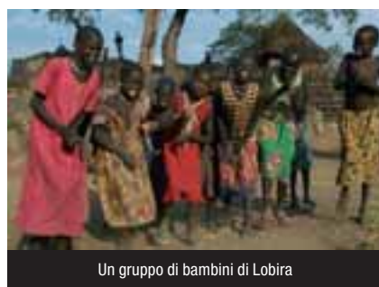
Un gruppo di bambini di Lobira

bambini e adulti ci vengono incontro, ridono mentre li fotografiamo. Ci aspettano altre tre ore di viaggio per arrivare a Isohe, ripartiamo. Non sentiamo la stanchezza. Osservo i miei compagni di avventura che non spendono parole in questi frangenti, hanno dimenticato il telefono, le commesse, gli ordini e gli insoliti. Stanno riempiendosi gli occhi della vita di qui, non commentano, guardano. Isohe è incastonata tra le montagne che si stagliano imperiose. Intorno tanto verde. Una scuola, un ricovero, un centro sanitario e la sede di AVSI: un campo con un ufficio in muratura e i bagni appena finiti, voluti per l'insistenza di Giampaolo Silvestri, direttore dei progetti in AVSI. Lo staff vive nelle tende. E' un avamposto per far fronte a una situazione complessa, di emergenza si usa dire. La luce è garantita dal generatore, l'acqua da un pozzo a caduta, non c'è frigorifero e le bibite calde non sono granché ma nessuno si lamenta.