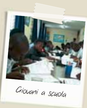
Giovani a scuola

Interventi che, uniti a quelli di Cité Soleil, puntano a una rinascita complessiva di Haiti, a una via d'uscita da violenza e degrado che passa attraverso il sostegno concreto alla popolazione più disagiata dell'emisfero Occidentale.