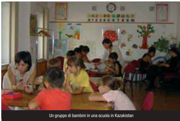
Un gruppo di bambini in una scuola in Kazakistan

Un importante segnale che indica una tappa decisiva verso un'applicazione del principio di sussidiarietà. Al tempo stesso devo riconoscere che il meccanismo che è stato messo in atto è abbastanza complicato e lento. È comunque un grande passo avanti.