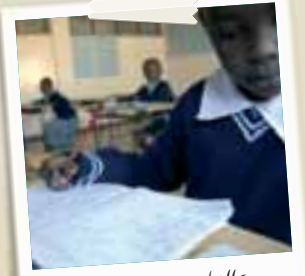
Un alunno della Little Prince

grande programma per il miglioramento della gestione delle acque per l'irrigazione tra il lago Qaraoun e il villaggio di Bar Elias. Il progetto punta a sviluppare tutte le risorse idriche, naturalistiche, economiche e sociali che traggono la loro potenzialità dal Litani, coinvolgendo coloro che dal fiume traggono il proprio sostentamento. Un altro progetto di AVSI è in corso a Baalbek, dove è in costruzione una nuova grande cisterna dell'acquedotto locale, che andrà a sostituire la precedente, distrutta durante il conflitto dell'estate scorsa. A progetto finito la cisterna garantirà l'approvvigionamento di acqua a oltre