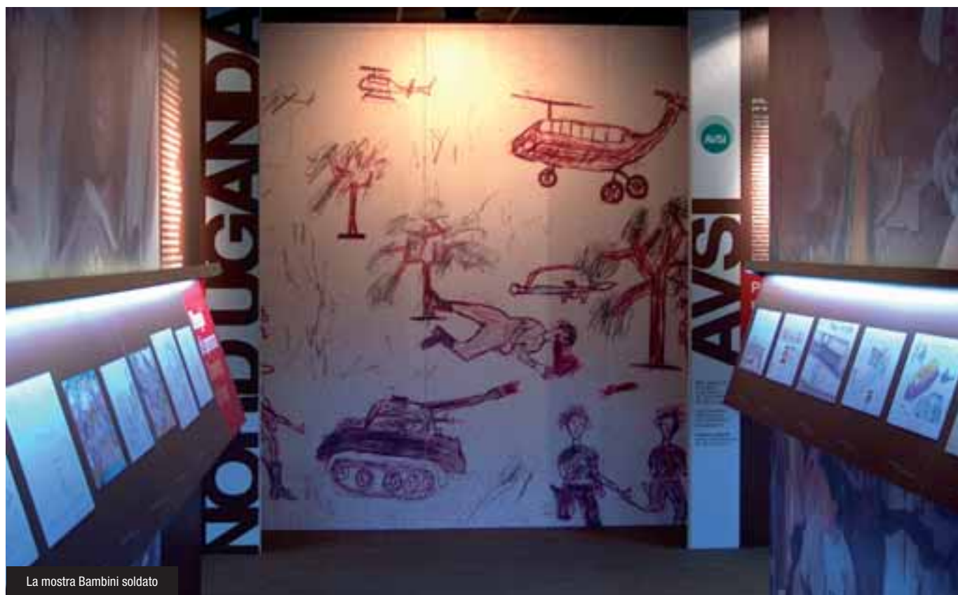
La mostra Bambini soldato

D ISEGNI DI GUERRA, DI PACE E DI SPERANZA PER NON DIMENTICARE L'INFANZIA NEGATA. Hanno percorso un viaggio molto lungo prima di arrivare in Italia, carico di sofferenza e di dolore. Bambini-soldato: una mostra itinerante che vuole scuotere le coscienze. Di Elisabetta Ponzone