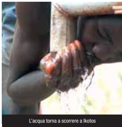
L'acqua torna a scorrere a Ikotos

A Ikotos i pozzi costruiti grazie a Humana ci sono e funzionano. Alcune migliaia di persone hanno da poco accesso all'acqua. Anche qui il nostro arrivo è una festa: