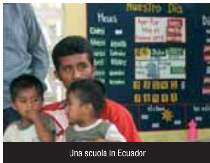
Una scuola in Ecuador

Dovrebbero raccogliere una sorta di sfida: chiedere l'istituzione a livello di Nazioni Unite della seconda assemblea. Attualmente l'ONU ha una sola assemblea che rappresenta gli Stati nazionali. Ma non basta. Una vera partecipazione di tipo democratico a livello mondiale esige una seconda assemblea che rappresenti anche i soggetti della società civile. Ovvero le organizzazioni non governative, le varie chiese, e