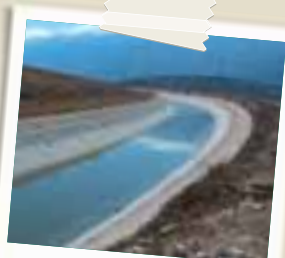
Il canale 900