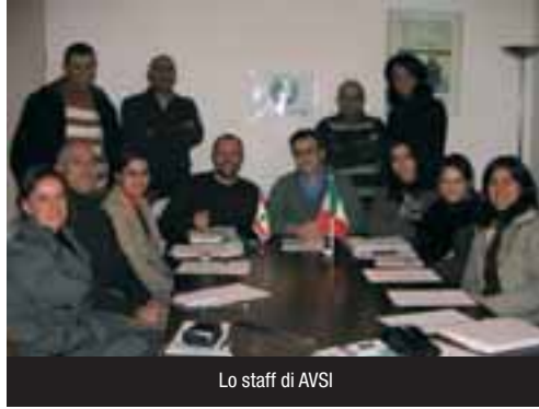
Lo staff di AVSI

45mila persone nell'area di Baalbek. AVSI sostiene in Libano circa 1.500 bambini grazie al sostegno a distanza.