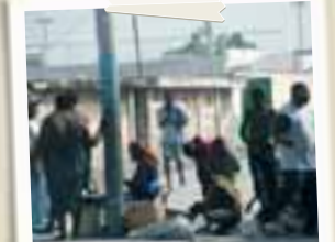
Una strada di Port au Prince