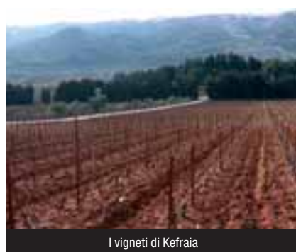
I vigneti di Kefraia

Pochi minuti e raggiungeremo il cantiere. Sembra impossibile credere che questo allegro fiumiciattolo la cui sezione arriva a sei, sette metri, durante il periodo primaverile porti tanta acqua da compromettere la possibilità di coltivare i campi, mettendo in ginocchio migliaia di sfollati che vivono in precarie tendopoli ai bordi dei centri abitati. I numerosi checkpoint dell'esercito ci riportano continuamente alla delicata situazione politica che attanaglia le popolazioni che vivono in questo angolo del Medio Oriente. E' una situazione veramente strana e contraddittoria: da un lato questa terra si trova al centro di una contesa internazionale che sembra non avere possibili vie d'uscita, dall'altro c'è una storia millenaria di convivenza tra etnie, popoli, culture.