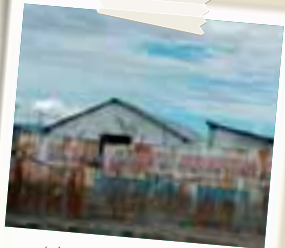
Un altro scorcio di Cité Soleil