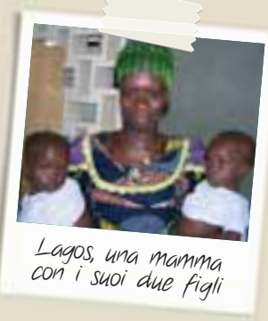
Lagos, una mamma con i suoi due figli