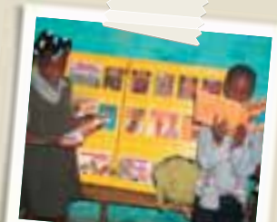
Esposizione di libri in una scuola