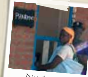
Distribuzione dei farmaci a Torit