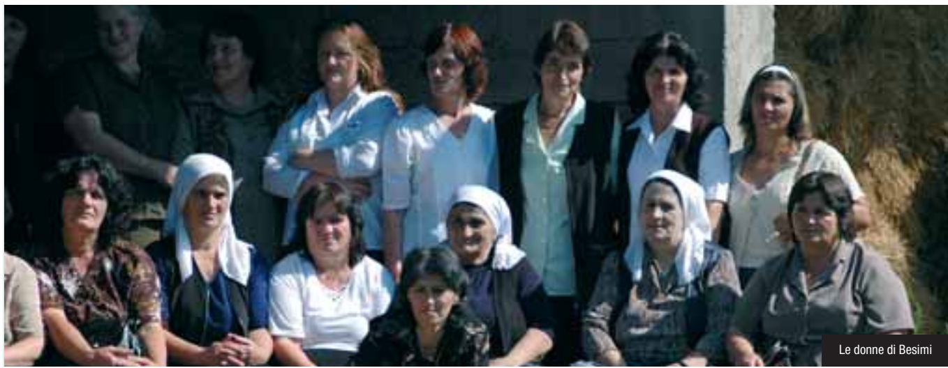
Le donne di Besimi

I N UN PAESE CHE HA VISSUTO IL TRAUMA DI UN CONFLITTO, un'associazione tutta al femminile guida il riscatto di una comunità intera. Storia di Besimi, dove si produce e si vende il latte: piccolo grande laboratorio di nuove speranze. Di Paolo M. Alfieri