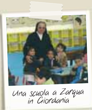
Una scuola a Zargua in Giordania

st-coloniale e pone l'accento sui pericoli derivanti dal crescere dello squilibrio nel moderno sistema economico se non c'è la persona al centro di tutto e una educazione attenta e adeguata. Profetica la parte sugli urti di civiltà, come la riflessione sulla ricerca di un umanesimo nuovo e di un mondo più fraterno e umano per tutti. Di grande attualità anche la sezione dedicata allo sviluppo sostenibile. L'enciclica può essere scaricata dal sito www.vatican.va