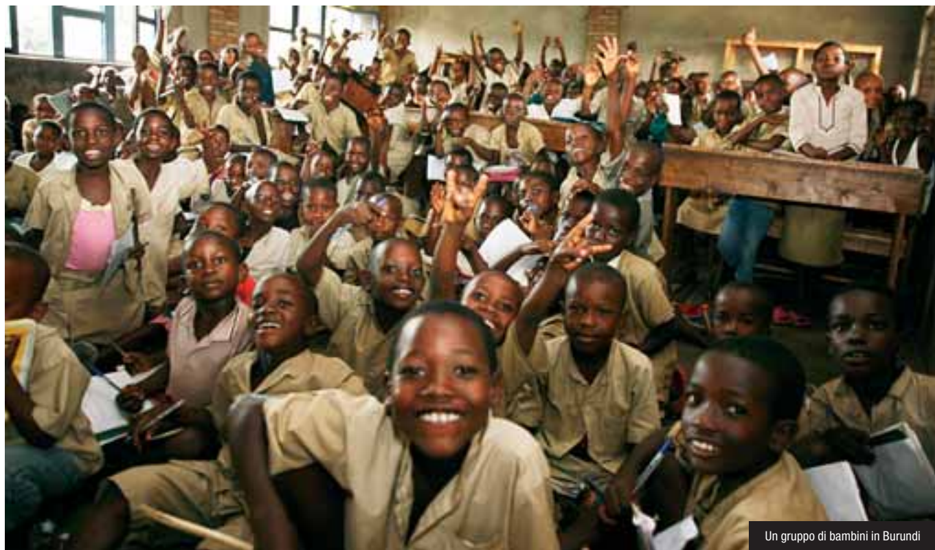
Un gruppo di bambini in Burundi

N EL 1967 VENIVA PUBBLICATA LA POPULORUM PROGRESSIO, la celebre enciclica di Paolo VI. Oggi come allora appare profetica per vincere la fame di pace nel mondo. Ne abbiamo parlato con Stefano Zamagni, docente di economia politica e direttore dell'Agenzia per le Onlus. Di Elisabetta Ponzone