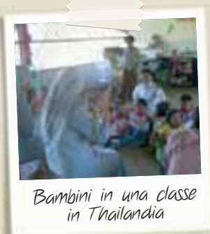
Bambini in una classe in Thailandia