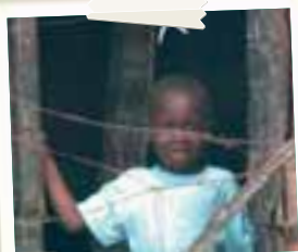
Un bambino di Cité Soleil