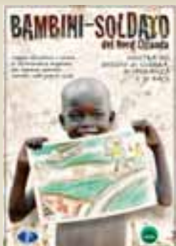
La locandina della mostra