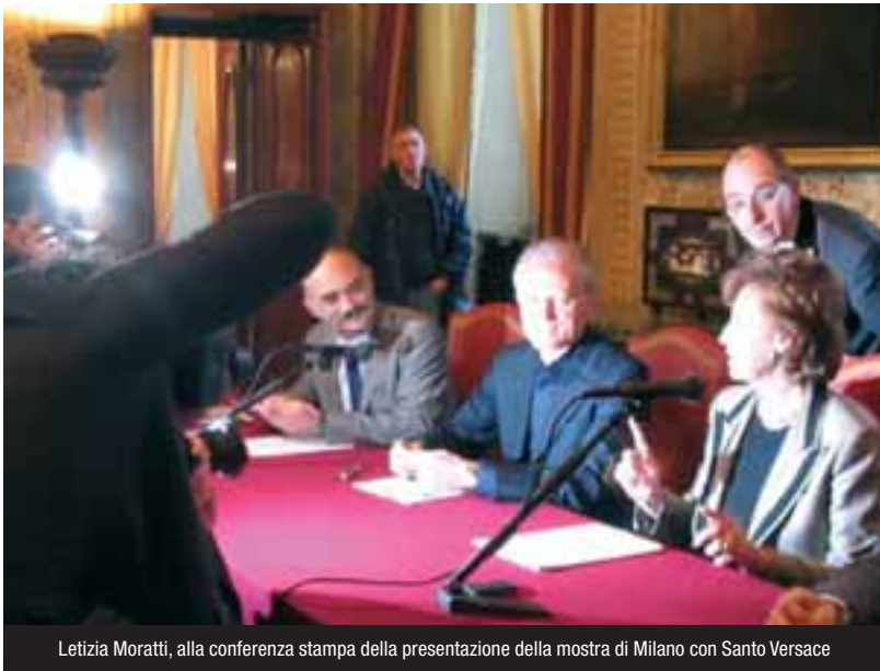
Letizia Moratti, alla conferenza stampa della presentazione della mostra di Milano con Santo Versace

La Sessione speciale dell'ONU a cui ha partecipato anche Agnes si è conclusa con il documento “Un mondo a misura di bambino”, che prevede quattro obiettivi prioritari: migliorare la salute, istruzione di qualità per tutti, protezione contro lo sfruttamento, combattere la diffusione dell'Aids. Pensare di proteggere l'infanzia con questo documento è riduttivo. I bambini nel mondo stanno come noi adulti li facciamo stare.