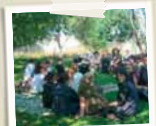
Le protagoniste di Besimi