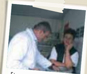
Il centro di raccolta del latte