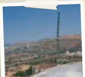
Vallata nel Sud del Libano