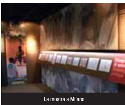
La mostra a Milano