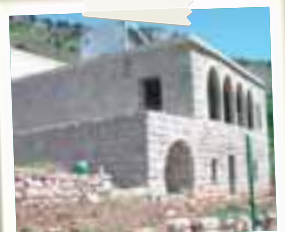
Il centro di formazione agricola AVSI a Kartaba