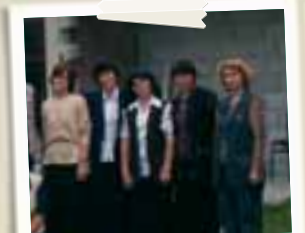
Altre partecipanti al progetto