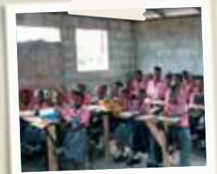
Lezione all'interno di una classe