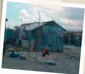
La bidonville di Cité Soleil