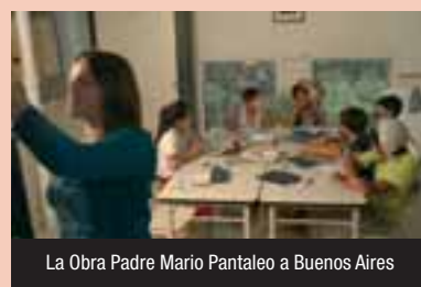
La Obra Padre Mario Pantaleo a Buenos Aires

centinaio di persone. Filo conduttore: l'impegno di AVSI al raggiungimento di uno degli obiettivi del Millennio, che prevede entro il 2015 la scolarizzazione per tutti, ma con un'attenzione particolare alla qualità dell'offerta della proposta educativa e alla sua sostenibilità. Sono stati così presentati i progetti e le attività nella cura dell'infanzia: circa 50mila bambini sostenuti con attività socio-educative di vario genere; la realizzazione o ristrutturazione