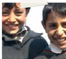
Bambini di Cojasca