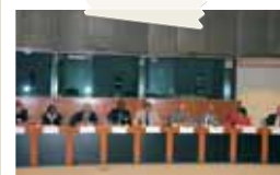
Eli oratori a Bruxelles

Prenotazioni libro: Marietti editore: tel. 02 67101053 - mariettieditore@mariettieditore.it