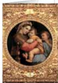
B5 | MADONNA DELLA SEGGIOLA Raffaello