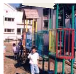
L'ospedale Victor Babes di Bucarest