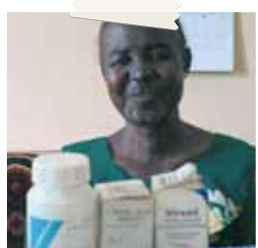
Un paziente e i 3 farmaci antiretrovirali

Nel paese il 60% della popolazione ha meno di 20 anni. Su 250 mila persone sieropositive, 22 mila sono bambini inferiori ai due anni, tanto che la prevalenza di Aids in questa fascia di popolazione raggiunge il 12%. Non proporzionata, tuttavia, è la risposta nazionale rispetto al trattamento: solo lo 0,02% di quelli eleggibili per il trattamento hanno accesso ai farmaci antiretrovirali.