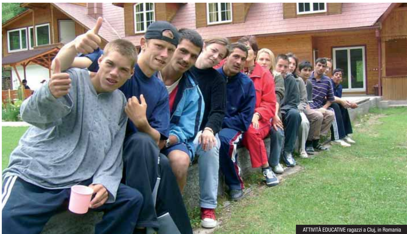
ATTIVITÀ EDUCATIVE ragazzi a Cluj, in Romania