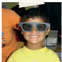
OXO controlla la vista ai bambini