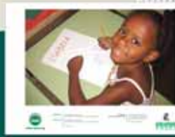
BIGLIETTO CALENDARIO CON BASE D'APPOGGIO