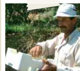
Un agricoltore in Libano

"Il Libano ha una cultura diversa degli altri paesi arabi: sono fenici, il 40% sono cristiani. Nessuno ha mai voluto la guerra. La velocità con cui la situazione sta precipitando è preoccupante. Come un colpo di spugna che ha cancellato i 15 anni di ricostruzione."