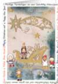
A3 | CHILDREN ON THE SLEDGE Lidia Granata