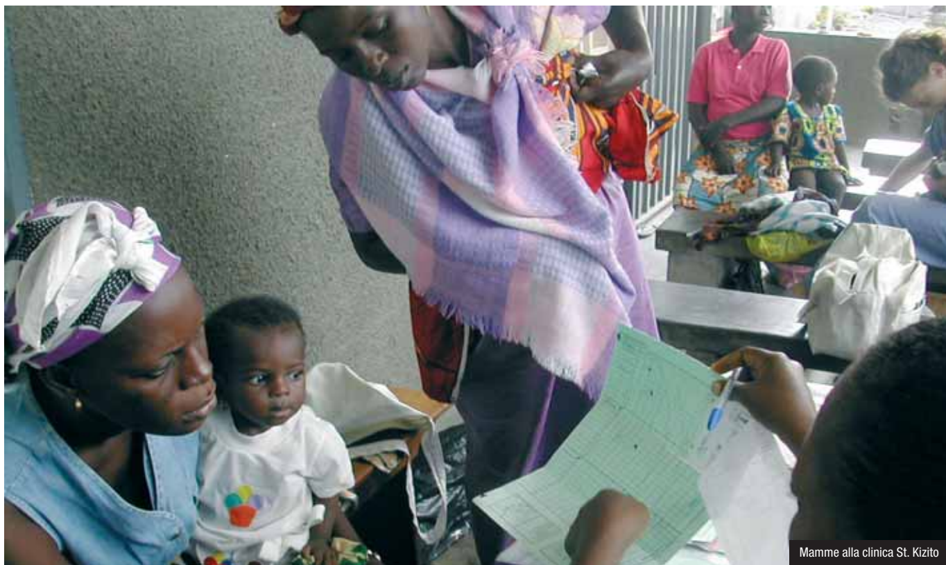
Mamme alla clinica St. Kizito

U NA GIORNATA A LEKKI, ALLA PERIFERIA DI LAGOS, IN NIGERIA, nella clinica St. Kizito. Una fantastica realtà sanitaria specializzata nella cura e assistenza dei malati di Aids. Oltre 300 i pazienti al giorno. Di Rodolfo Casadei , giornalista del settimanale Tempi