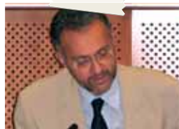
Mario Mauro, vicepresidente del Parlamento europeo