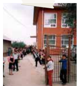
La scuola a Cojocasca