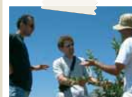
Corsi di formazione in Libano