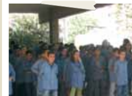
Bambini sostenuti a distanza con AVSI