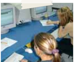
L'ospedale Victor Babes di Bucarest