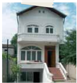
Casa Edimar a Bucarest.