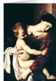
B1 | MADONNA DEI PELLEGRINI Caravaggio