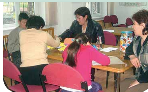
Ragazzi del centro giovanile di Almaty, Kazakistan

Un dibattito e un confronto sull'educazione tenutosi lo scorso gennaio al Centro giovanile di Almaty, in Kazakistan, scaturito dopo la proiezione del film francese "Les Choristes - I ragazzi del coro" e promosso da MASP, l'associazione locale partner di AVSI che nel paese asiatico realizza progetti in sostegno dell'educazione e della formazione al lavoro prevalentemente a favore di ragazzi disagiati. Il film, che narra la storia di alcuni ragazzi ospiti di un istituto per minori difficili e del particolare rapporto che nasce con il loro insegnante di musica, è in realtà lo specchio del cambiamento possibile dell'essere umano se seguito, accompagnato e stimolato al dialogo. All'evento hanno partecipato tutti gli assistenti sociali che lavorano con i bambini invalidi del Centro di occupazione e della difesa sociale del quartiere Turksibskij, gli educatori della