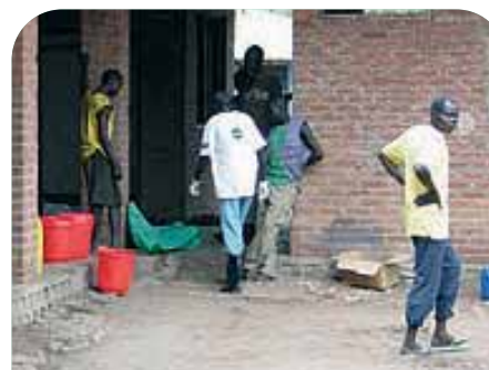
AVSI in Sud Sudan nell'ospedale di Torit