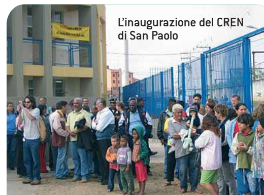
L'inaugurazione del CREN di San Paolo

sperienza reale che la denutrizione, oltre a danneggiare definitivamente le capacità fisiche dei bambini, si associa a violenza e disagio sociale. Caratteristiche che contraddistinguono le aree informali suburbane delle grandi metropoli e nelle quali AVSI, da oltre 20 anni è presente in Brasile con programmi mirati alla riduzione della pover-