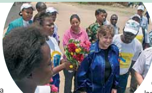
Ann Veneman direttore generale UNICEF

Il 28 febbraio scorso, il direttore generale UNICEF, Ann Veneman (già segretario del dipartimento di Agricoltura del governo Bush), è stata in visita al villaggio di Baraka, nel territorio di Fizi, nella instabile provincia del Sud Kivu della Repubblica Democratica del Congo, dove AVSI opera in sostegno alla popolazione principalmente con progetti di emergenza, alimentari ed educativi. Nell'ambito di una missione UNICEF di valutazione sull'impatto effettivo dei progetti finanziati dal Fondo delle Nazioni Unite per l'infanzia, il direttore Veneman ha visitato la scuola elementare Mamayemo che ospita 800 studenti e 14 insegnanti, ristrutturata