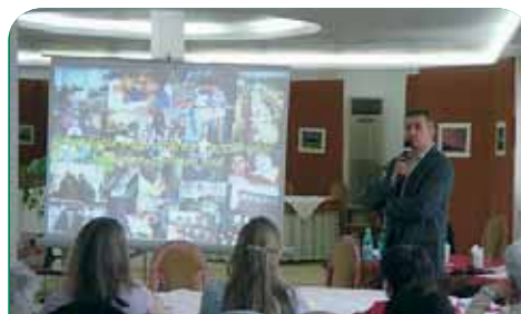
Un momento del seminario a Bucarest